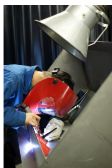
Grundforløb: SMEDE / MASKINOMRÅDET

Bager, konditor, detailslagter, ernæringsassistent, kok, industrislagter, receptionist, tjener.