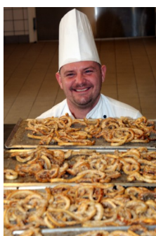
Grundforløb: HOTEL OG RESTAURANT

Skjern Tekniske Skole, lørdag den 28. januar fra kl. 10 til 14